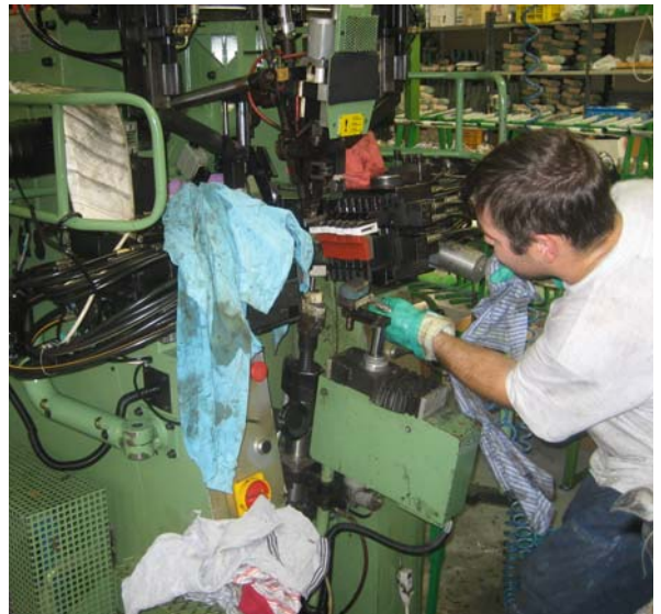
Decontaminazione di un macchinario