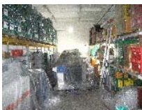
Apparecchiature protette da cellophane e trattate con deumidificatori