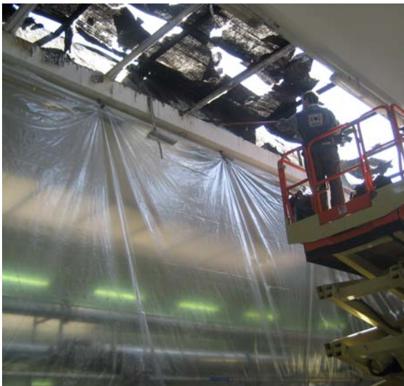
Rimozione dei residui di combustione

BELFOR ha portato a termine il proprio compito con grande soddisfazione da parte di tutte le parti coinvolte: i tempi di fermo produzione sono stati minimizzati ed il campionario estivo sarà presentato in fiera come da programma.